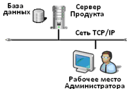
Рисунок 1. Архитектура системы

В базовую конфигурацию RUN24 также входит рабочее место администратора RUN24, позволяющее удаленно взаимодействовать с модулем “АДМИНИСТРАТОР”.